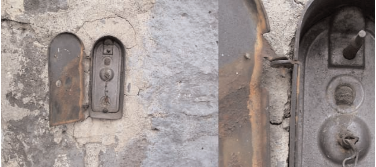
Imagen 010, Algo diario... 2011

Curso: Pertenencia contra Globalización Sede: Centro Nacional de las Artes Duración: 23 de marzo 2006