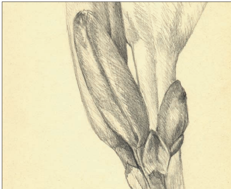
Flor de un día, lapiz sobre papel, 2006