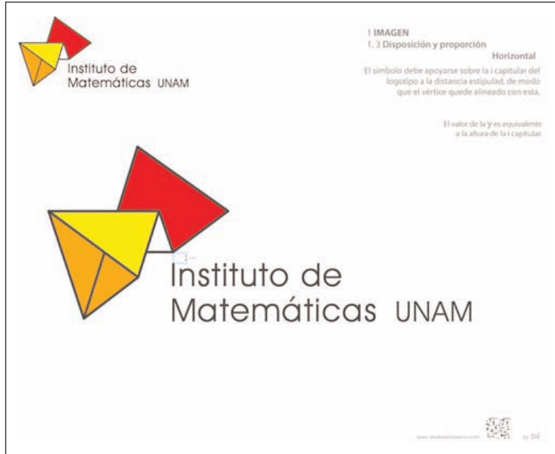
Logotipo para el Instituto de Matemáticas de la UNAM