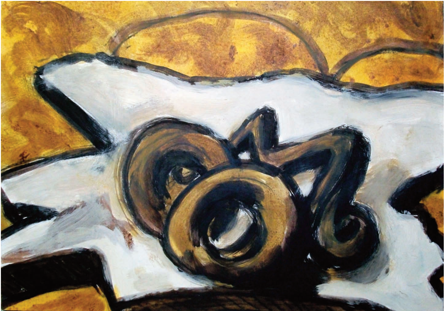
Dos aros, tinta sobre papel, 2011